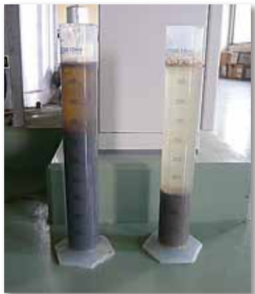
<농업 집락 배수처리시설> 오타니 감량화