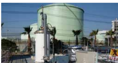
<화력발전소> 유화 수소 제거