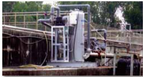
양돈장 폐수 정화