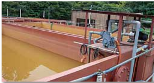
오염 토양 정화