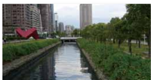
<대만 카오룽시> 신광로 배수명로 수질개선