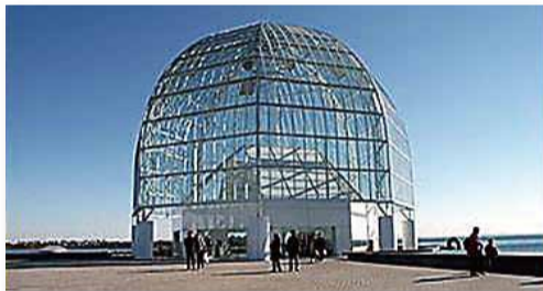
카사이 임해수족원·수산 양식