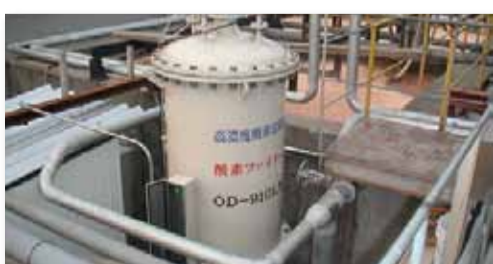
<폐수처리> 약취 · 소음 · 탈수 오타니의 저감