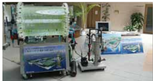
해초류증식 시스템 매장건본