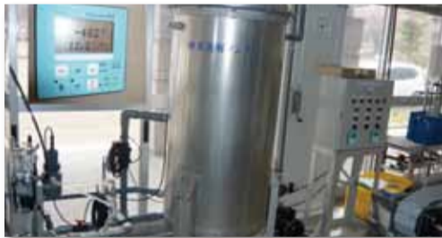
<기능수의 제조> 수소수 · 산소수